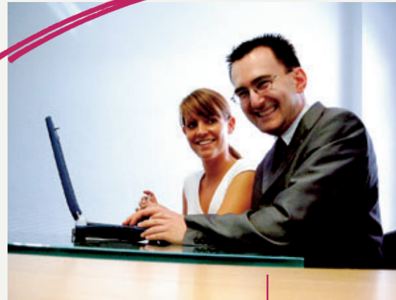
Bei uns sind Sie in guten Händen

Wir sind Ihr Partner. Wir coachen, unterstützen Sie. Wir vermitteln Sie.