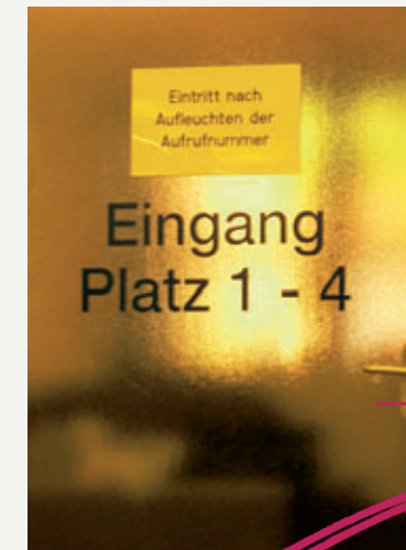
Bei uns sind Sie keine Nummer

Mehr noch: Um Ihnen den Wiedereinstieg zu erleichtern, begleiten wir Sie bei Bedarf auch noch, wenn Sie Ihre neue Aufgabe bereits angetreten haben. Bei Fragestellungen mit dem Arbeitgeber stehen wir Ihnen dann weiterhin gerne als Ansprechpartner und Mittler zur Verfügung.