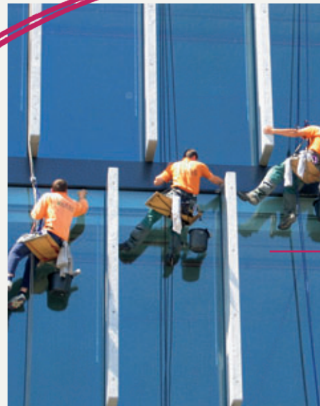
Wir lassen Sie nicht hängen - verlassen Sie sich drauf!